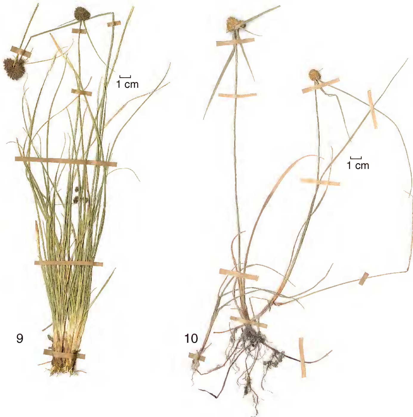
Figs. 9 y 10. 9. Karinia mexicana (Britton) Reznicek & McVaugh. E.D. Enríquez 3083 y M. Adame (CIIDIR). 10. Oxycaryum cubense (Poepp. & Kunth) Palla. R. Fernández y A. Magaña 1064 (CIIDIR).

(ENCB, MEXU), N. Diego 1760 (FCME, XAL), 1771 (FCME, XAL), 5178 (FCME, MEXU), A. Novelo 2236, 2306, 2319, 2578, 2812, 2813, 2847, 2857, 3369 (MEXU), A. Novelo y A. Lot 450 (ENCB, MEXU), V. L. Ramos 00387 (MEXU), L.S. Rodríguez 2083 (IEB) (Fig. 10).